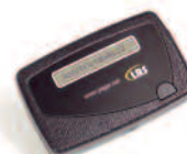
Alphanumeric a una riga